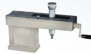
手動式平行整輪(PSGS, PSGC) *PSGS-1535M, 1545M, 2045M除外