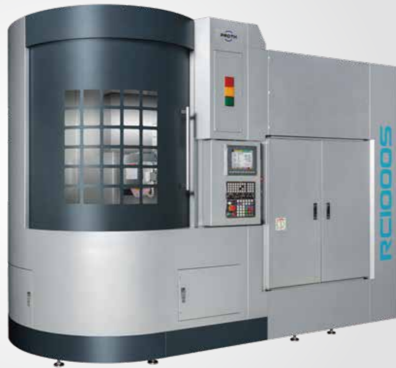
PSRC - 1000S