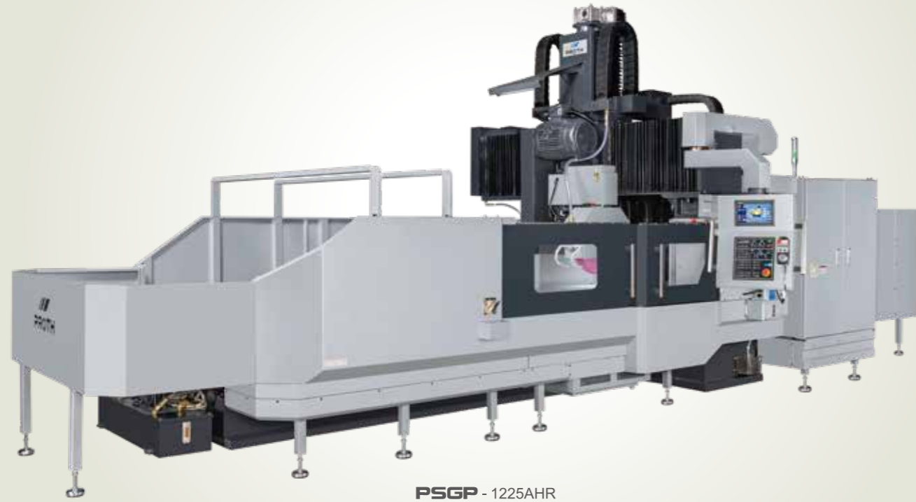
PSGP - 1225AHR