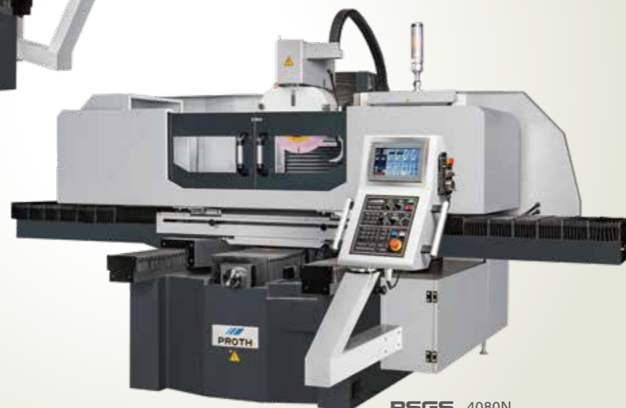
PSGS - 4080N