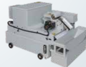
過濾紙式 附 / 不附磁鐵冷卻裝置