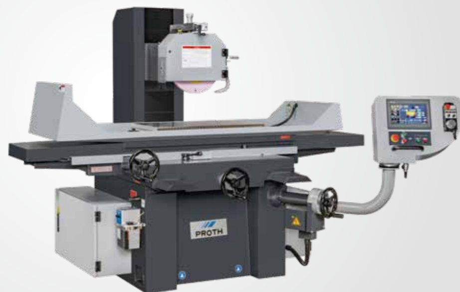
PSGS - 4080AHR