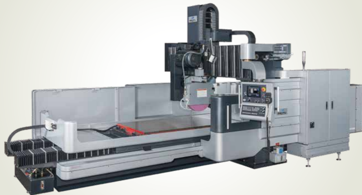
PSGP - 1020AHR