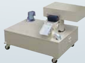
濕式附磁鐵冷卻裝置