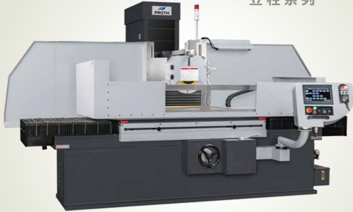
PSGC - 60120AHR