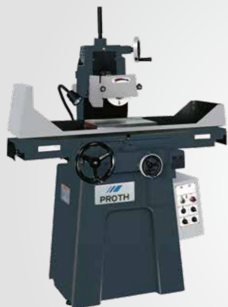
PSGS - 2045M