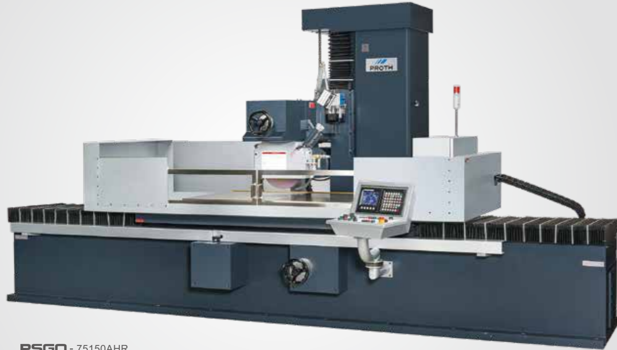
PSGO - 75150AHR