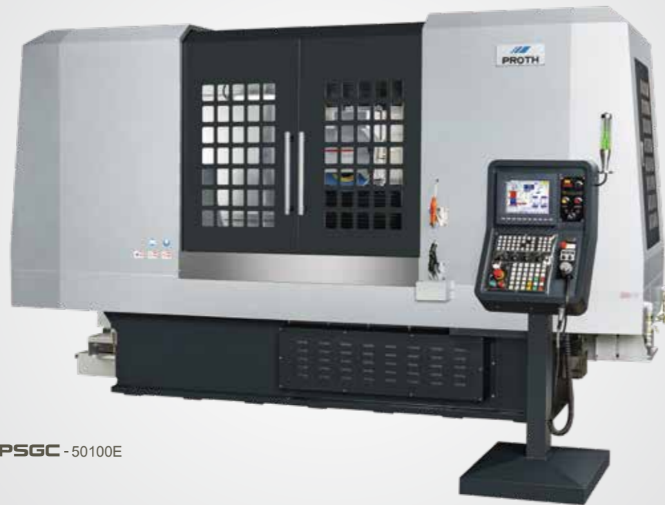
PSGC - 50100E