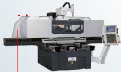
視窗型前防濺擋板(PSGS) (前後行程會減少30-50mm)