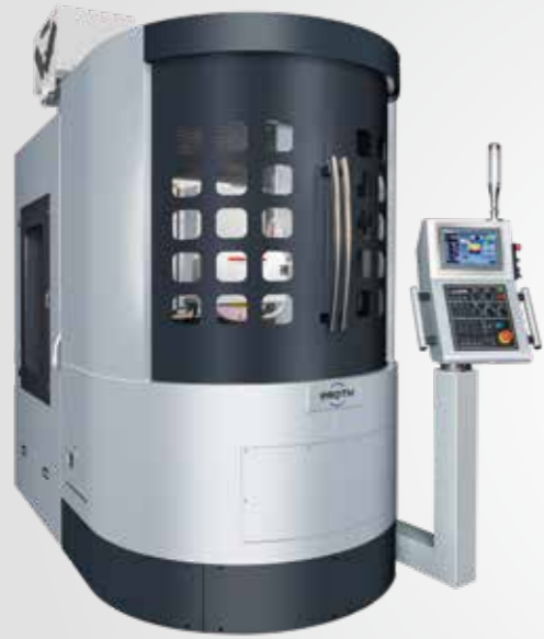
PSRC - 600S