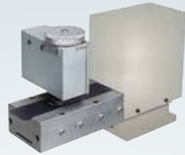
兩軸自動平行整輪： 前後一般馬達+上下步進馬達