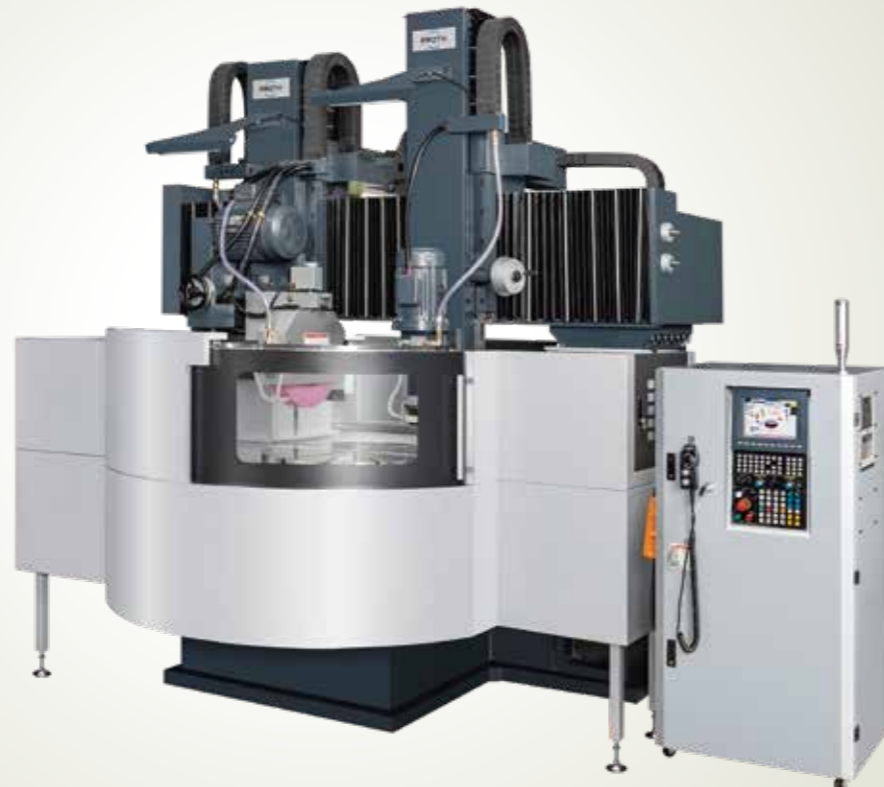
PSRP - 1000S