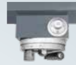
上下 / 前後微調裝置 (PSGS-2550AH, 3060BH, 4080AHR)