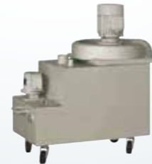
乾 / 溼兩用吸塵器(PSGS)